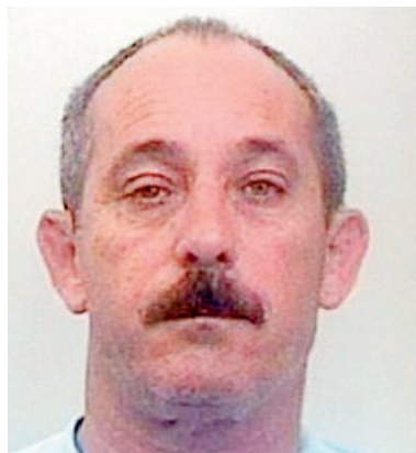
GASPARE DARDO PRIMO GRADO: 7 ANNI APPELLO: CONFERMATA