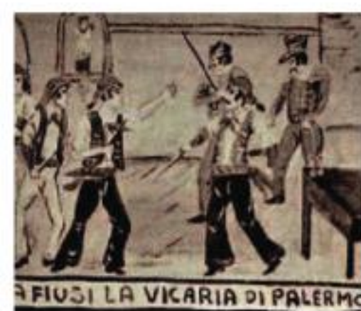
FIJUSI LA VICARIA DI PALERMO

1865 La parola "mafia" compare per la prima volta in un rapporto ufficiale del prefetto di Palermo